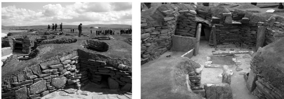
Рис. 3. Кам'яні приміщення Скара-Брей

нобританських та французьких мегалітичних пам'яток. Тодішнє населення (здебільшого носії культури бороздчатої кераміки ) мешкало у житлах іншого типу. Рештки споруд у Мардені, Дарингтоні та Маунт-Плезанті Мак-Кай і Вуд на пряму пов'язують із кам'яними селищами Корнуолу (Карн-Брі) та особливо Оркнеїв (Райнїо чи Скара-Брей) (рис. 3). Питома вага працевитрат на кам'яні меблі, їх вишуканість і ще багато рис вказують на статусність мешканців таких жител. І є підстави вважати, що населення британських та бретонських пагорбів робило аналогічні статусні меблі до аналогічних конструкцій з дерева. Ці конструкції були оточені системою ровів та валів, званою в археології як хенджі . Такі житла – явно помешкання жрецької еліти неолітичної людності Західної Європи [5, с. 245–246].