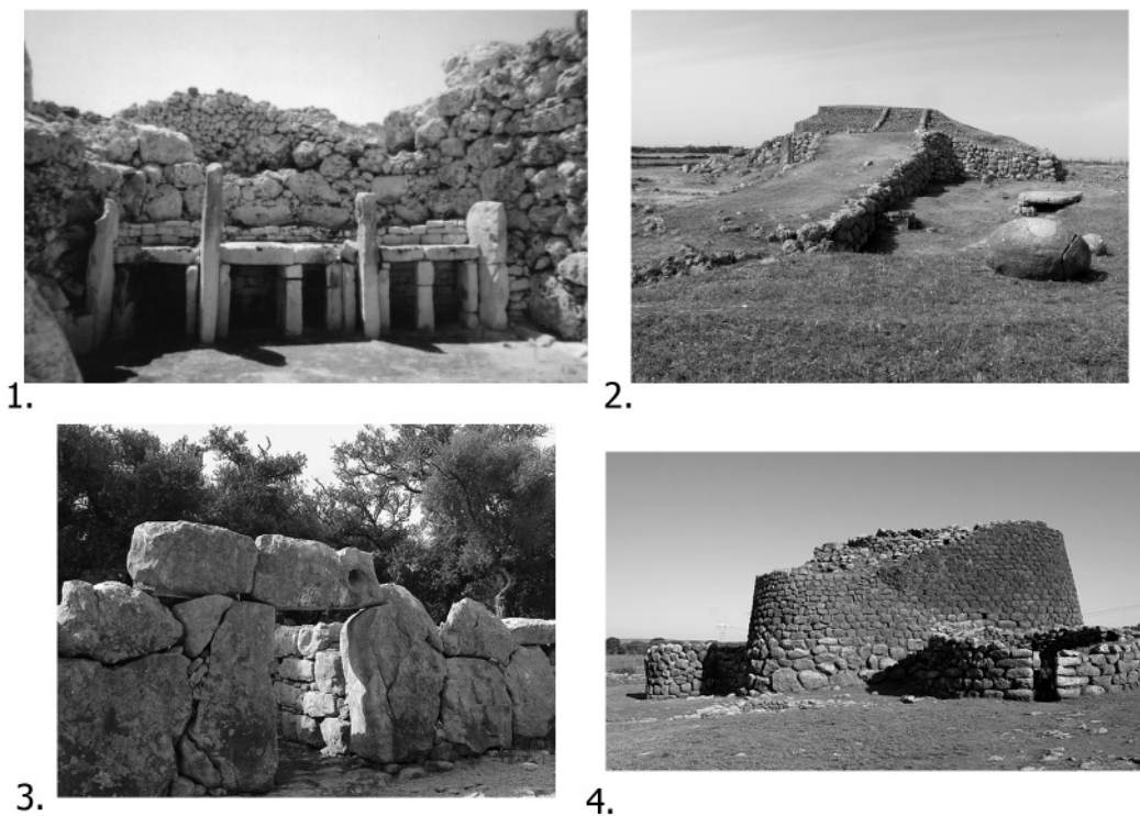
Рис. 2. Мегалітика Західного Середземномор'я: 1 – Культурний комплекс Джгантія, Мальта (прибл. 3600–2500 рр. до н. е.); 2 – «Сардинський Зікурат» (Монте-Дакодді) (прибл. 3200–2800 рр. до н. е.); 3 – Культура талайотів. Головний вхід до пос. Сес-Паісес, Майорка (1300–800 рр. до н. е.); 4 – Нураг біля селища Лоса, Сардинія (початок I тисячоліття до н. е.)

У цьому контексті варто навести спостереження Ендрю Шерратта, який досліджував генезу мегалітів. По-перше, він відразу поділив мегалітичну традицію Західної Європи на дві фази: перша охоплює період 4500–3500 рр. до н. е. (калібр.) (власне доба активної неолітизації Європи); друга – приблизно з 3500 р. і до початку II тисячоліття до н. е. (цю фазу називає неомегалітичною і зазначає, що тут уже дослідник має справу з новим розумінням та використанням). Мегаліти другого періоду з'являються на нових територіях і зосереджені між поселеннями зовсім іншого типу, ніж мегаліти доби становлення [39, с. 148]. По-друге, Шерратт висловив припущення саме щодо курганів. Перші монументальні неолітичні камерні поховання Західної Європи спочатку робили у великих довгих курганах, які згодом почали обкладати камінням. Такі монументальні поховання, зазначає Шерратт, поширились по периферії осілих розвинених землеробів Центральної Європи (певно, мають на увазі культури мальованої кераміки) [39, с. 149–150]. У цьому випадку мова йде про пам'ятки Німеччини та Західного Середземномор'я. Висловлено тезу, що одним із приводів використання у спорудах великих кам'яних масивів стала потреба колишніх мезолітичних збирачів та мисливців консолідувати сили колективу. Це стало статусним показником – рушієм міжплеменної взаємодії.