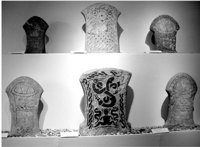
Рис. 5. Мальовані поховальні стели довікінзької Скандинавії

Загалом, щодо степових пам'яток Надчорномор'я та їх поширення по Європі давно зроблено цікаві спостереження та світоглядні узагальнення [10; 21; 22]. Індоевропейська культова сфера досліджена непогано і має чудові ілюстрації в міфах відповідних народів, а також у пам'ятках архаїчного мистецтва носіїв цих традицій [2; 24]. Пережиткове мисливське суспільство Європи доби неоліту-бронзи також вивчається доволі плідно [7; 15; 16; 23; 26]. Досить чітко реконструйовано культово-світоглядні схеми близькосхідних землеробів [1; 13; 30]. Відповідно, є всі підстави виокремити й системно проаналізувати світоглядні аспекти творців мегалітичної спадщини.