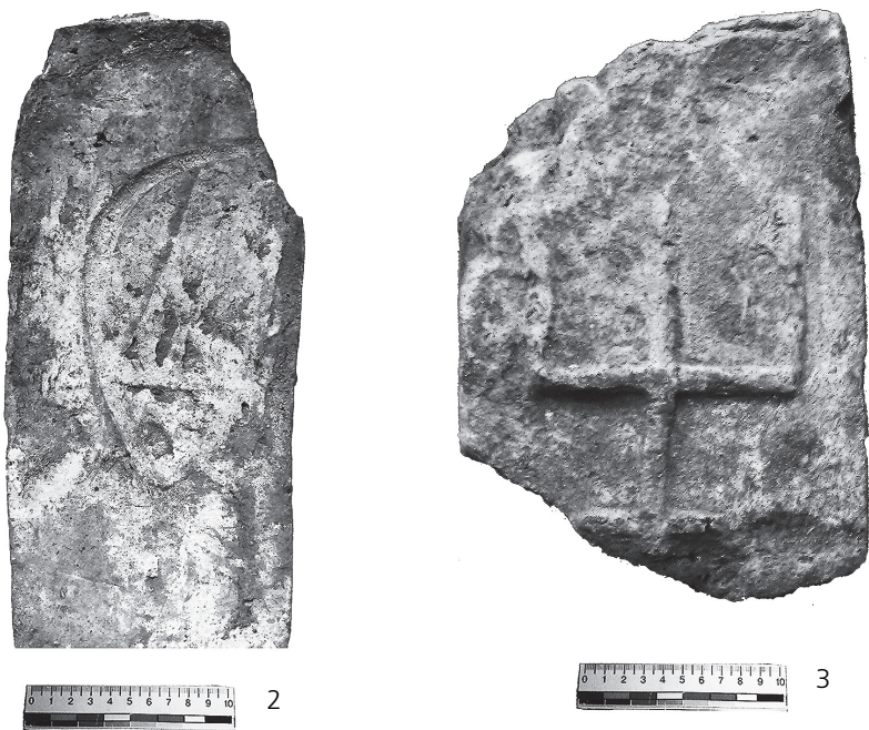
Рис. 1. Плінфи із знаками тризуба із зібрання НМІУ:

1 – НМІУ, інв. № в-4553/111. X ст. Київ, садиба М. Петровського (Володимирська 2). Розкопки В. В. Хвойки 1907 р.; 2 – НМІУ, інв. № в-4932; X ст. Київ, садиба М. Петровського (Володимирська 2). Розкопки В. В. Хвойки 1907–1908 рр.; 3 – НМІУ, інв. № в-5362. XII ст. м. Володимир-Волинський. 1990 р.